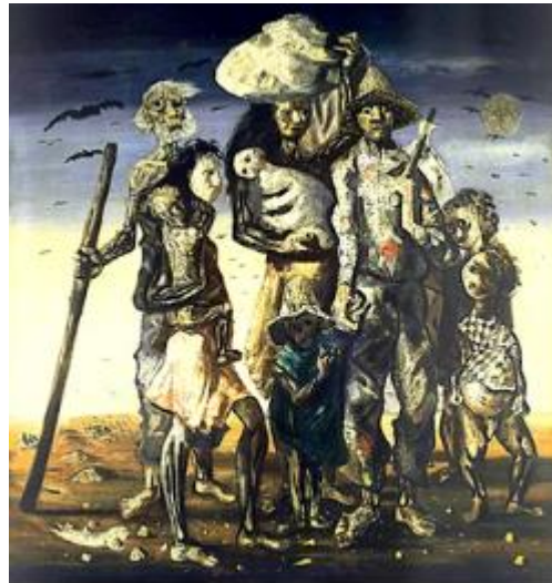
,Retirantes (1944), de Portinari