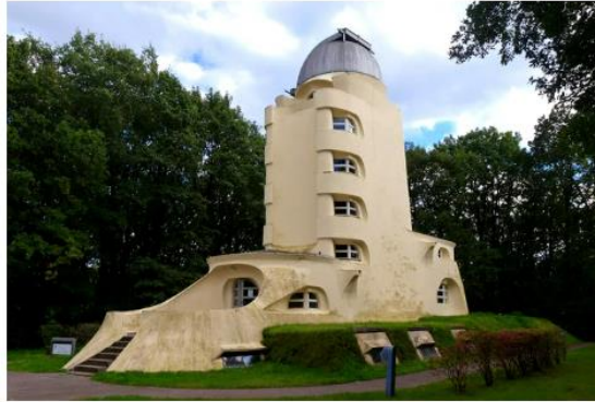
Vista exterior e interior da Torre Einstein Potsdam (1921), de Erich Mendelsohn