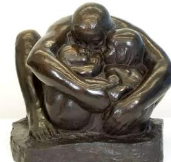
Mãe com os filhos (1927 - 1937), da artista Käthe Kollwitz